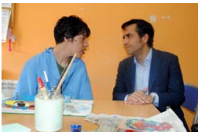
O conselleiro de Política Social, José Manuel Rey Varela, visitou en Vilagarcía de Arousa as instalacións da Asociación de Discapitados Psíquicos "Con Eles"

o desenvolvemento de accións de asesoramento e formación de persoas con discapacidade.