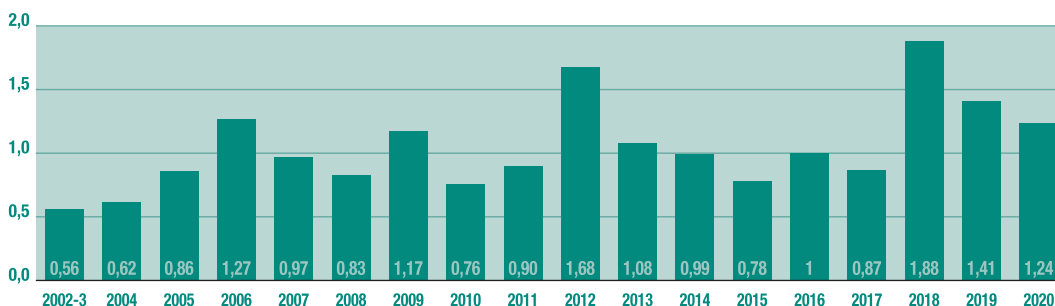
Tasa detección casos/1.000 nenos: Anos 2002-2020

A taxa de detección no período 2002-2020 é de 1,06 por mil nenos cribados. No ano 2020 a taxa de detección foi do 1,24 por mil nenos cribados.