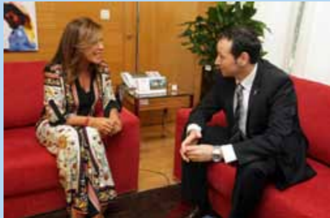
A conselleira de Traballo e Benestar, durante o encontro que mantivo co conselleiro da Presidencia do Principado de Asturias

Para avanzar nesta liña, a Xunta realizou un “gran esforzo” por impulsar o Plan de dinamización demográfica 2013-16, horizonte 2020, que foi aprobado no Parlamento de Galicia o pasado mes de abril.