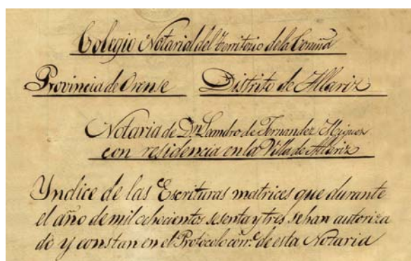
En los protocolos del año 1863 aparece reflejada por primera vez la nueva organización territorial del notariado. AHP OU, Protocolos notariales de Leandro de Fernández Míguez , notario en Allariz, C. 131.

Según el vigente Decreto de 1945, en las capitales provinciales que son sede de un colegio notarial , este puede contar con un archivo histórico de protocolos que custodie aquellos que, procedentes del distrito notarial de la capital, tengan más de veinticinco años. También podrá recibir los protocolos centenarios procedentes de otros distritos. Estos archivos deben contar con instrumentos de descripción de sus fondos y ofrecer servicio de consulta de la documentación centenaria a los investigadores. El Colegio Notarial de Galicia (denominado Colegio Notarial de A Coruña hasta el año 2002) cuenta con un archivo de estas características en su sede de la ciudad herculina.