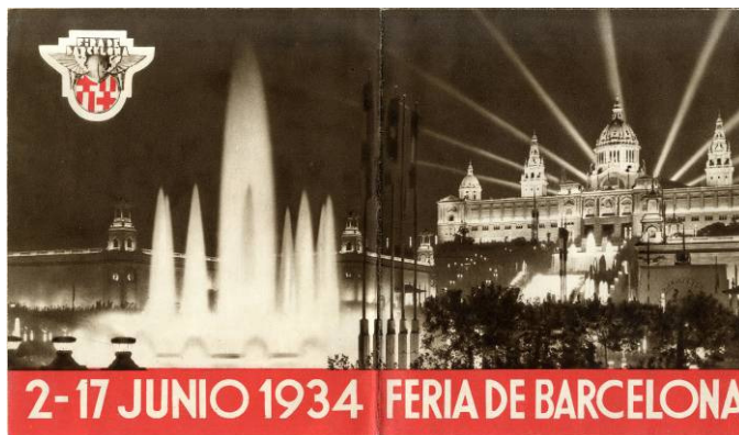
Portada do folleto promocional da Feira de Barcelona do ano 1934.