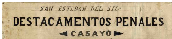
Cartela que acompañaba á documentación dos destacamentos penais. AHPOu. Prisión Provincial de Ourense.

cesión de 62 reclusos traballadores para que se incorporen ás “Minas de Casaio, Balborrás (Carballada de Valdeorras)” en réxime de liberdade vixiada. A cambio, a empresa satisfaría os seguros sociais e o pagamento da seguinte maneira: debía aboar ao recluso a mesma cantidade que lle correspondía a un traballador libre do sector, é dicir, nunca menos de 8 pesetas. Pero, en realidade, o soldo real do penado só ascendía ás 2 pesetas, o equivalente aos gastos do seu mantemento, á asignación familiar e á asignación persoal. As