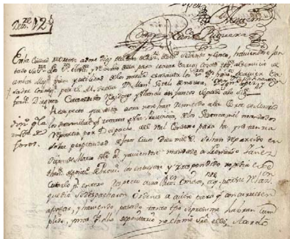
Acta de la sesión del Concejo de Ourense de 12 de diciembre de 1765 en la que se trata la cuestión de la perpetuidad de los foros. AHPOu, Concello de Ourense , L. 117, fol. 43 r.

Aparecen nuevas tipologías documentales como los libros de contabilidad (de mayordomía, de propios, del pósito ...), los libros de ordenanzas, o las informaciones de hidalguía y de limpieza de sangre. Otra documentación que se conserva de la Edad Moderna es la relativa a la elección y nombramiento de oficios concejiles, a obras públicas y urbanismo, a caminos y bienes de propios, a patronato de ermitas y hospitales, a salubridad pública, a festejos ... También se produjeron documentos generados por competencias que los concejos perdieron durante la Época Contemporánea, como los expedientes judiciales civiles y criminales o la documentación relativa a la administración de la cárcel.