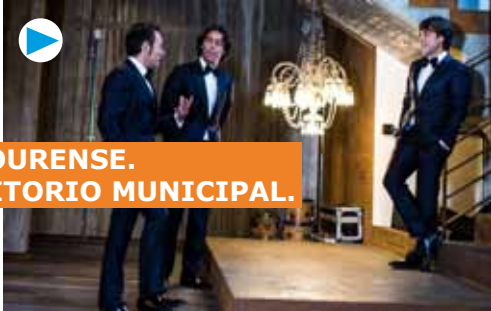
CAFÉ QUIJANO. OURENSE. 4 DE XUÑO. AUDITORIO MUNICIPAL.