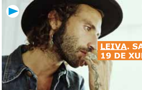
LEIVA. SANTIAGO. 19 DE XUÑO. PAZO DE CONGRESOS.