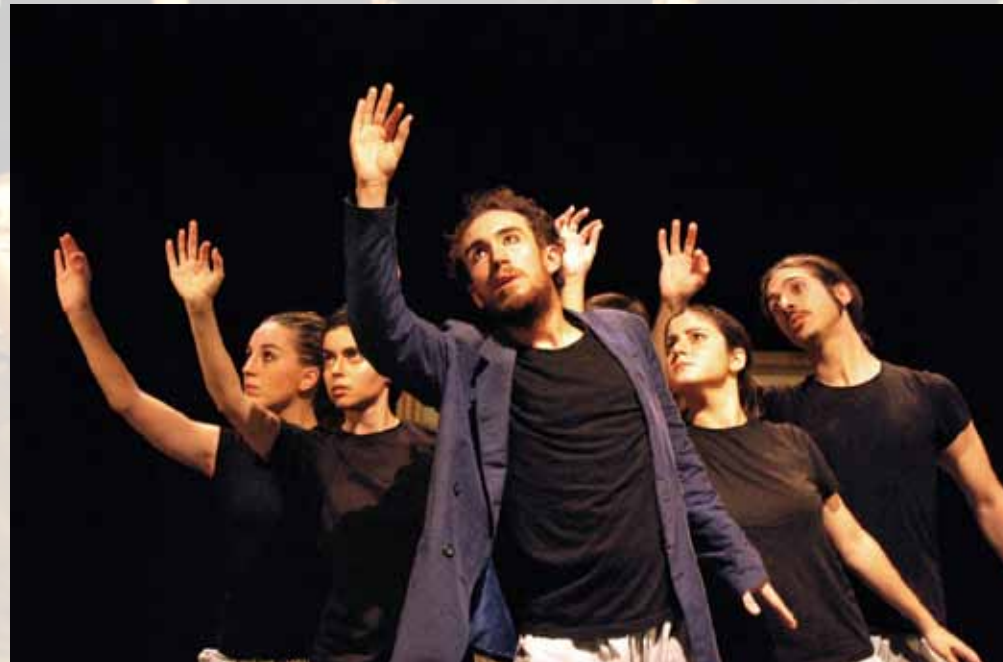
Gran parte da peza teatral aséntase na expresión corporal

O primeiro fillo do matrimonio Van Gogh chamárase Vincent, pero morreu no parto. Exactamente un ano despois, xusto aos 365 días, nace o segundo fillo, que volven chamar Vincent. É o pintor, o noso protagonista. Aí xa comeza a historia. É un