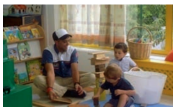
Donald W. Winnicott