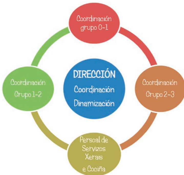
Exemplo de organigrama dunha escola de cinco unidades

na recepción das familias e nenos, no lavado de roupa, xunto a tarefas administrativas básicas; todo isto é fundamental para permitir a mellora continua das prácticas diarias.