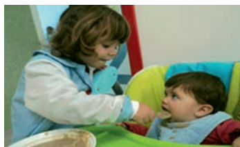
Lev S. Vigotsky