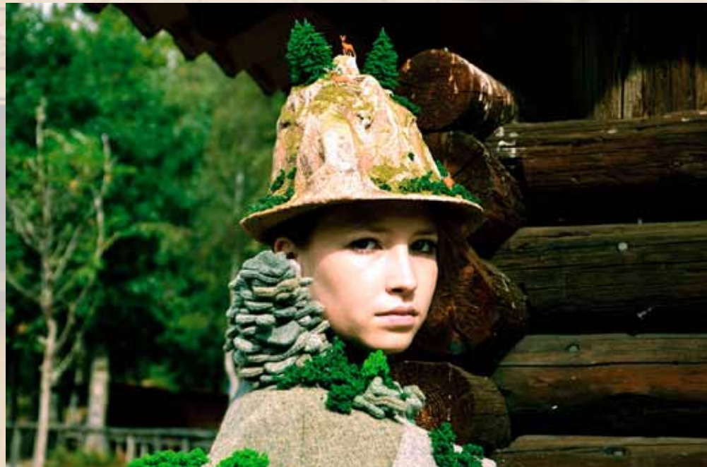
Pazos inspirouse na paisaxe de Suíza para a colección Cu-cú

- Tendo en conta esta creatividade artística, cres que é unha colección que se podería levar