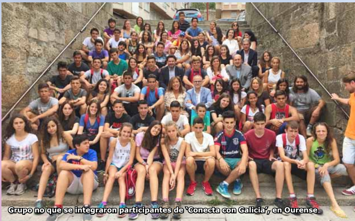
Grupo no que se integraron participantes de 'Conecta con Galicia', en Ourense

O interese nesta iniciativa é tal que este ano se incrementou un 5 % o número de prazas. Para moitos dos participantes, supón o primeiro contacto coa terra dos seus devanceiros e mesmo coa parte da familia que ficou na chamada Galicia territorial cando a outra tivo que marchar para a diáspora.