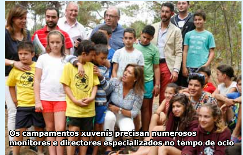
Os campamentos xuvenís precisan numerosos monitores e directores especializados no tempo de ocio

Mais non é, por suposto, o único beneficio dos campamentos, que posibilitan o incremento das habilidades sociais para os máis novos e ofrecen un recurso de conci-