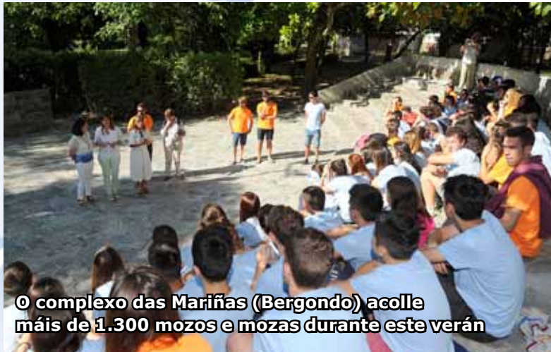
O complexo das Mariñas (Bergondo) acolle máis de 1.300 mozos e mozas durante este verán

dicas, os participantes efectúan outras nas que cobran máis protagonismo as tarefas de voluntariado e de interacción social.