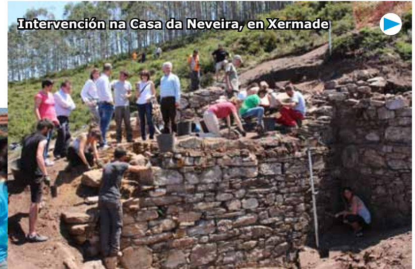
Intervención na Casa da Neveira, en Xermade

Por exemplo, en Rois (A Coruña) prosegue na primeira metade de agosto o campo de intervención arqueolóxica no castro de Socastro, con escavación, prácticas de limpeza, siglado e debuxo arqueolóxico. Preto de alí, en Padrón, efectúan labores de dinamización e conserva-