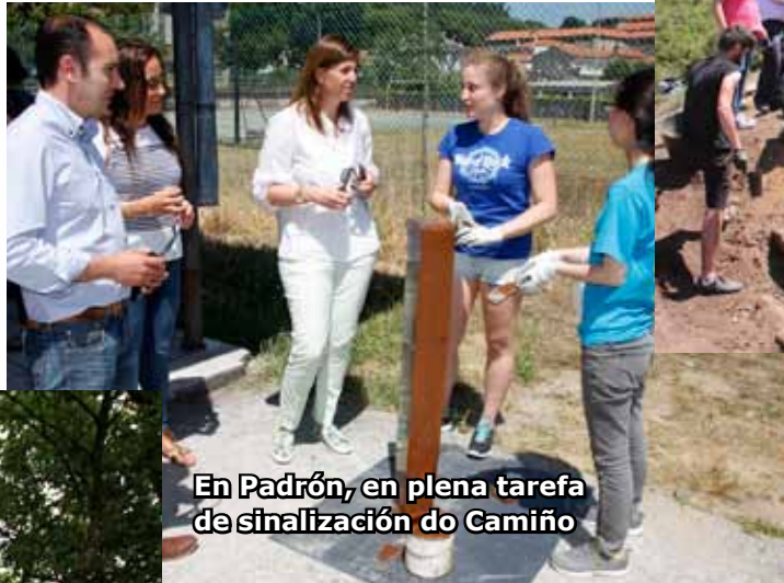
En Padrón, en plena tarefa de sinalización do Camiño

que se complementan con múltiples actividades lúdicas, festivas e de aprendizaxe, case sempre vinculadas ao patrimonio e ás tradicións das súas zonas.