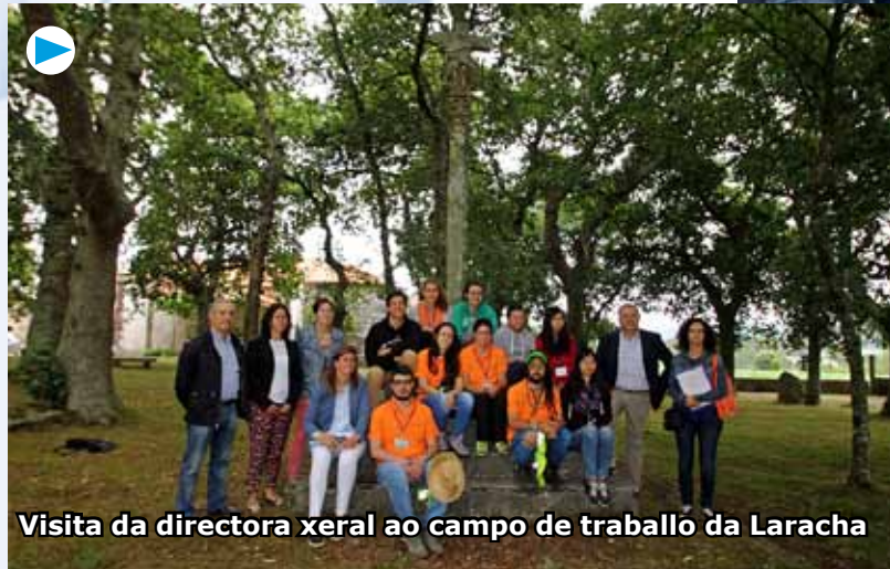
Visita da directora xeral ao campo de traballo da Laracha

Sen saír da Coruña, na Laracha recuperan o roteiro e o muíño do río no Bradoso e no Acheiro. E en Xermade (Lugo), destaca o campo da Casa da Neveira , tamén centrado na arqueoloxía e con vistas a unha eventual recuperación futura. Son estes dous bos casos de intervención no patrimonio natural e histórico galego, que os participantes teñen así a ocasión de coñecer.