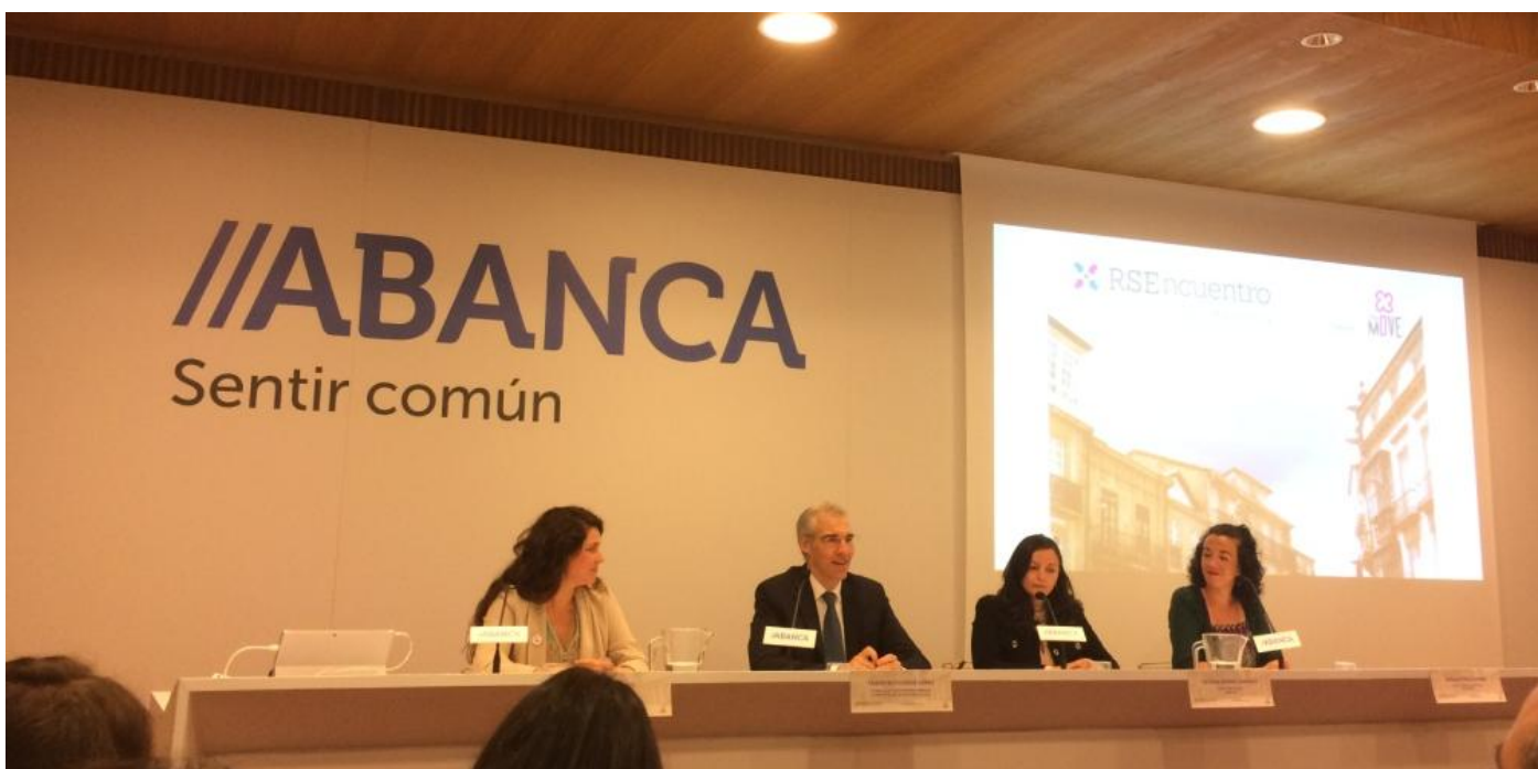
A sede de Abanca, en Santiago de Compostela, foi o lugar que acolleu a celebración do III RSEncuentro.