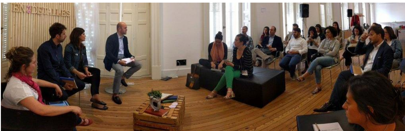
Diversas imaxes ilustrativas doRSEncuentro. @RSEncuentro