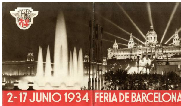
Portada del folleto promocional de la Feria de Barcelona del año 1934.