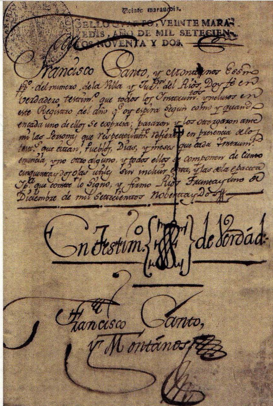
Diligencia de peche do protocolo de Francisco Canto y Montanos. 1792