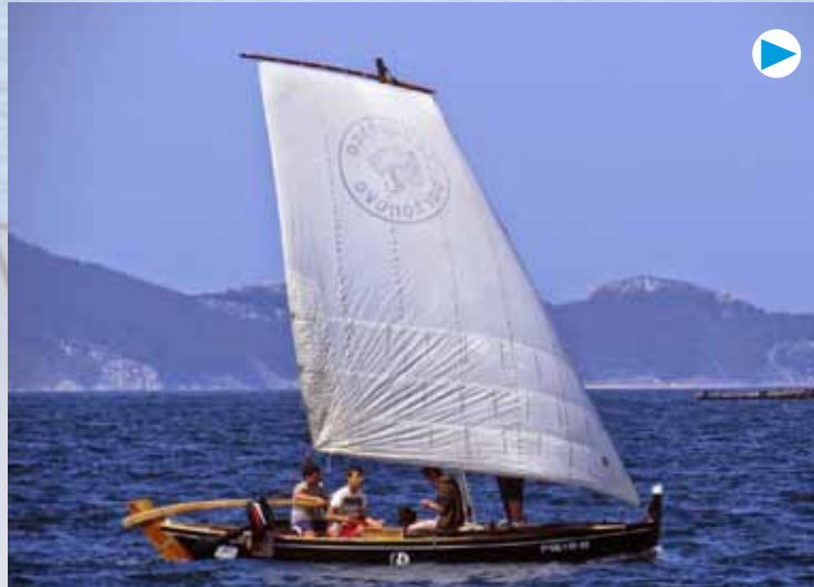
A navegación en dorna atrae moita mocidade

Tal como asegura a asociación, a intención e que os participantes coñezan as embarcacións tradicionais de Galicia e á vez disfruten co seu uso, coa pretensión de "concienciar sobre a necesidade de conservar vivo este rico patrimonio". Amigos da Dorna explica que moitos dos participantes ignoraban esta "parte importante da súa cultura", polo que a súa iniciativa ser-