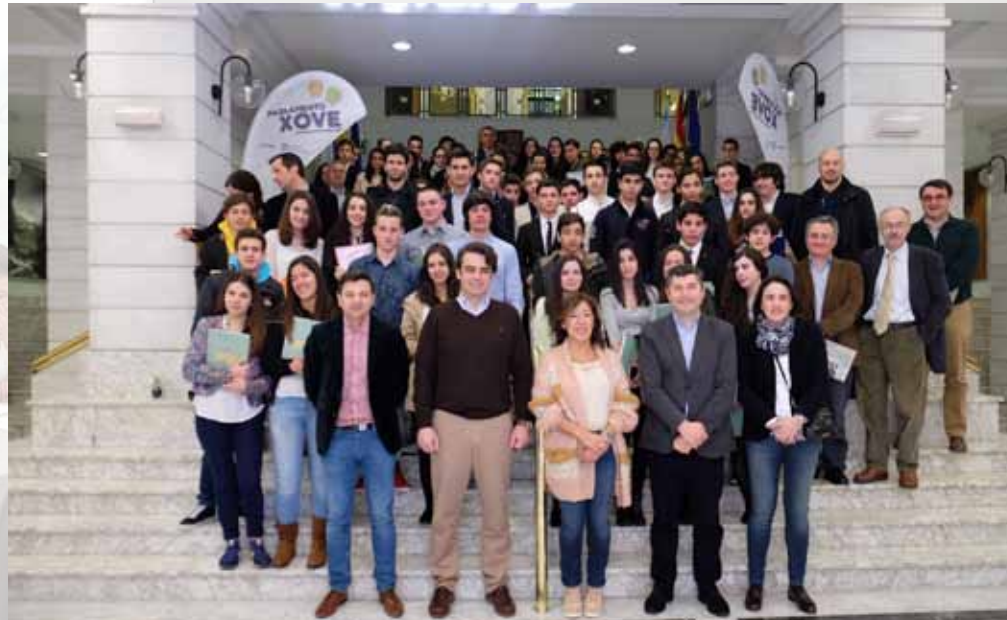
Xornada clasificatoria na categoría da ESO na Deputación da Coruña

Na final da ESO, a pregunta formulada é: "Desaparecerán as salas de cine como forma de ocio?". Lévese así ao debate un tema recorrente na actualidade dos últimos anos, co pe-