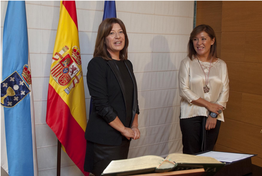
Carmen Bouso, nueva Directora Xeral de Traballo e Economía Social

creo que en Galicia existe un tejido empresarial de pymes y empresas de nueva creación que están creciendo, que son una alternativa de futuro sólida y que, afortunadamente, están sabiendo integrar la RSE de forma natural. Esto, en el medio y largo plazo, estoy convencida que distinguirá todavía más a la RSE gallega como una RSE comprometida con el entorno, cercana a las demandas de sus grupos de interés y con un importante componente de sostenibilidad.