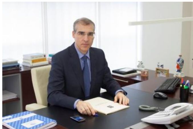
Francisco Conde López, conselleiro de Economía, Emprego e Industria

Por último, pero non menos importante, desde esta consellería seguiremos pola senda da colaboración institucional con todos os interlocutores que queiran implicarse coa RSE en Galicia. Desde os gobernos locais ás institucións europeas, pasando polas entidades sociais, sindicais, empresariais ou de calquera outra