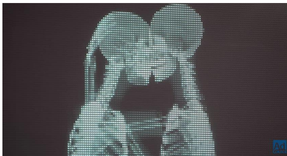
Love Has No Labels | Diversity & Inclusion | Ad Council

https://www.youtube.com/watch?v=PnDgZuGIhHs